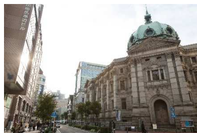
神奈川県立歴史博物館