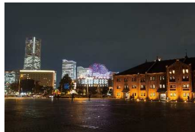
横浜赤レンガ倉庫