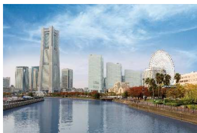
横浜ワールドポーターズ/横浜ランドマークタワー